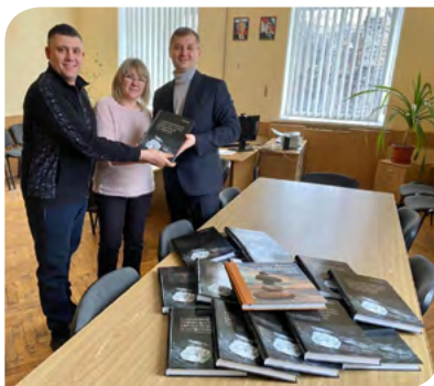
На снимке: сотрудники Донбасского национального технического университета (Луганская Народная республика) с корпоративными изданиями АО «АГД ДАЙМОНДС».

Книга передана в такие организации, как государственный геологический музей им. В. И. Вернадского, минералогический музей им. А. Е. Ферсмана, Донецкий национальный технический университет, Донбасский государственный технический университет, институт геологии и минералогии им. В. С. Соболева, научная библиотека МГУ, Министерство природных ресурсов России и другие.