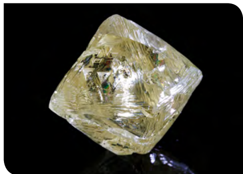
Писахов. Алмаз массой 52,61 ct