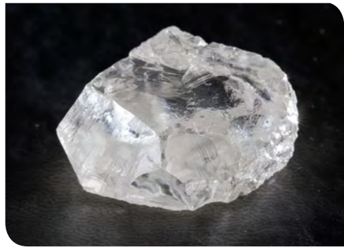
Ардалин. Алмаз массой 95,22 ct

Алмазу весом 71,95 карат, добытому 27 мая 2023 года, присвоено имя «Владимир Воронин» в честь представителя известной поморской династии моряков Владимира Ивановича Воронина (1890 – 1952). Капитан дальнего плавания, участник первых Карских экспедиций. Командуя ледоколом «Георгий Седов», участвовал в поисках экипажа итальянской экспедиции У. Нобиле. В 1931 году ледокол «Александр Сибиряков» под командованием В. И. Воронина впервые в мировой истории совершил сквозной переход по Северному морскому пути за одну навигацию. В 1933-1934 гг. – капитан парохода «Челюскин», участник знаменитой эпопеи челюскинцев.