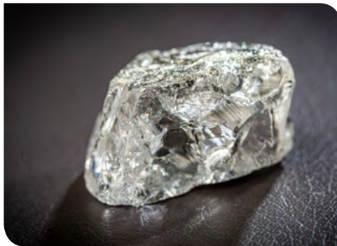
Воронин. Алмаз массой 71,95 ct