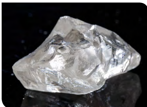
Черепанов. Алмаз массой 81,58 ct