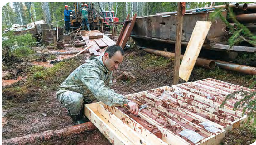
Сентябрь 2020 года. Проведение геологоразведочных работ АО «АГД ДАЙМОНДС».

чтобы уравнивать Архангельскую область с субъектами Российской Федерации, на территориях которых участки для геологического изучения предоставляются пользователям на срок до 7 лет. Если изменения вступят в силу, они позволят более эффективно проводить геологическое изучение, поиски и оценку месторождений полезных ископаемых на территории нашей области», — отметил председатель комитета Архангельского областного Собрания по лесопромышленному комплексу, природопользованию и экологии Александр Дятлов.