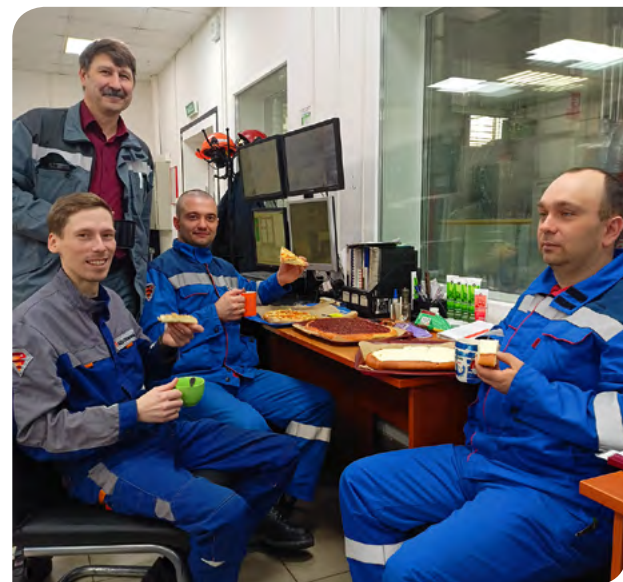
Цех энергоснабжения отмечает День геолога на трудовой вахте.