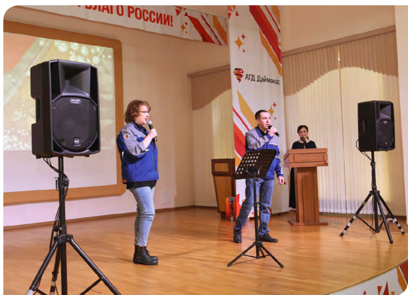
Выступление музыкальной группы «Горняк».