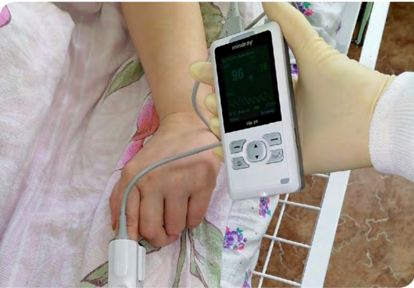
Новый пульсоксиметр и другие аппараты сразу стали использовать в терапевтическом и хирургическом отделениях Мезенской ЦРБ.

Благодаря «АГД ДАЙМОНДС» в Мезенской ЦРБ появились монитор пациента IMES 8 Mindray с измерением артериального давления, два пульсоксиметра Mindray PM-60, электрокардиограф трех/шестиканальный ЭКЗТЦ-3/6-04 «Аксион» и набор инструментов для сосу-