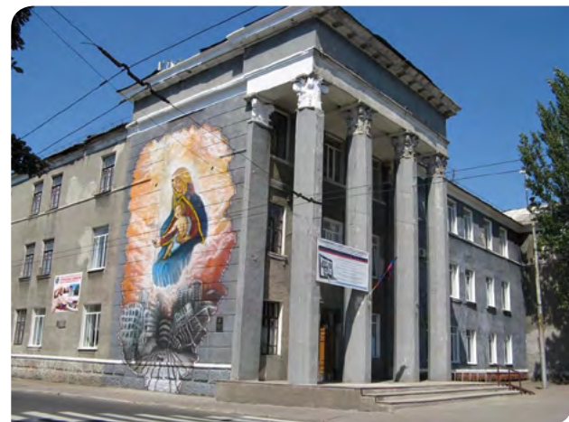
В сентябре 2022 г. Горловский техникум отметит 145-летний юбилей.

Еще раз огромное спасибо за подарок. Надеемся, что это событие станет началом длительного плодотворного сотрудничества, общения и дружбы между нашими организациями».