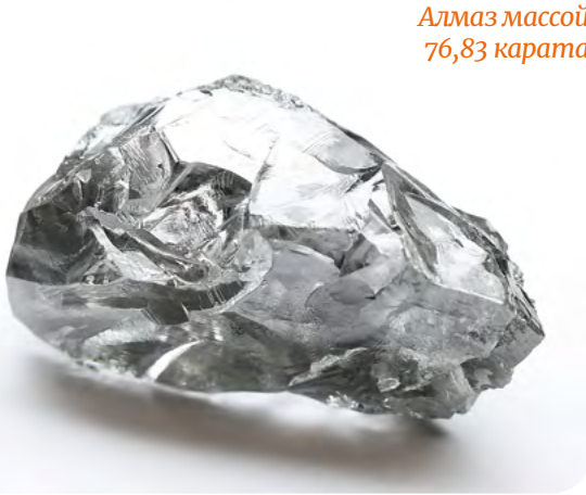
Алмаз массой 76,83 карата