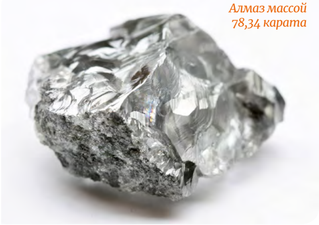
Алмаз массой 78,34 карата

ди особо крупных алмазов, добытых на месторождении им. В. Гриба с начала промышленной отработки. АО «АГД ДАЙМОНДС» – вторая алмазодобывающая компания России. По объему добычи месторождение им. В. Гриба входит в десятку крупнейших в мире.